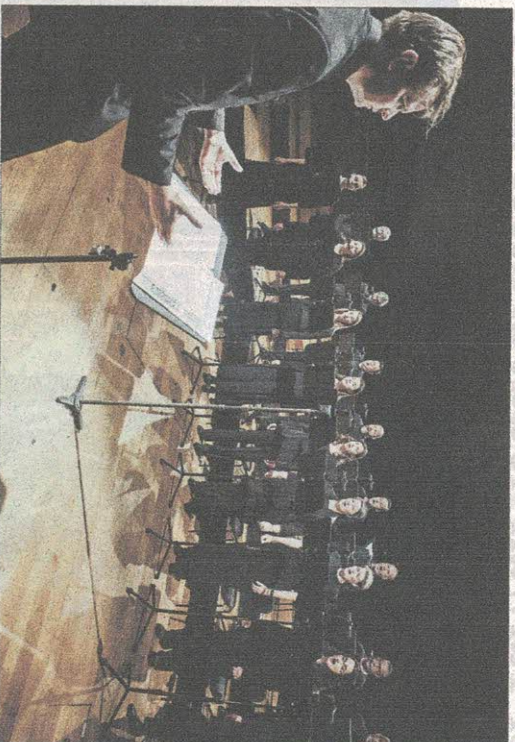
The Pilgrim Song is te beleven in Geel, Lier, Brussel, Antwerpen en op Iedereen Klassiek in Brugge.