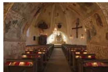
Het kerkje in Bromma

De LISAS ontmoeten elkaar als bij toeval. Zelf schrijven ze daarover: "Een zaadje werd geplant tijdens een gemeenschappelijk optreden in Opatija, Kroatië. Toen begon ons muzikale gesprek. Samen spelen is net zo goed luisteren als praten. Het is moeilijk te zeggen wie leidt of volgt, en het maakt niet uit. We kunnen onszelf gewoon even vergeten en dat is een luxe en een geschenk. Bij het maken van muziek, voelen we niet de behoefte om in termen van genre te denken. Zweedse volksmuziek is een basis voor ons allebei, maar andere stijlen waarmee we ons bezighouden, of waardoor we geïnspireerd zijn, hebben ook een belangrijke plaats in onze muzikale taal.